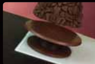
BASE PINO Cod. Art. 12304 La base è un articolo a sè stante e come tale va acquistato a parte.