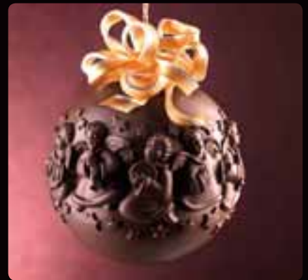
GUSCIO SFERA ANGELI MUSICI Cod. Art. 12603