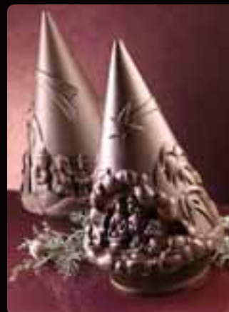
GUSCIO PINO PRESEPE Cod. Art. 12303

Tutti i soggetti PINO hanno un diametro di base di cm 16 per h cm 23.