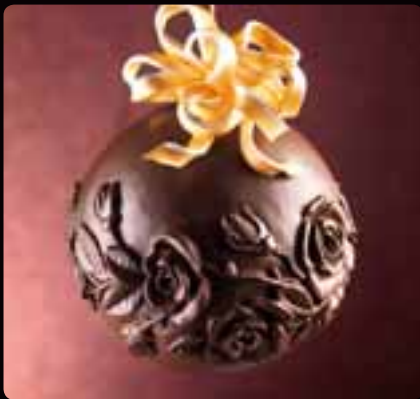
GUSCIO SFERA ROSE Cod. Art.12601