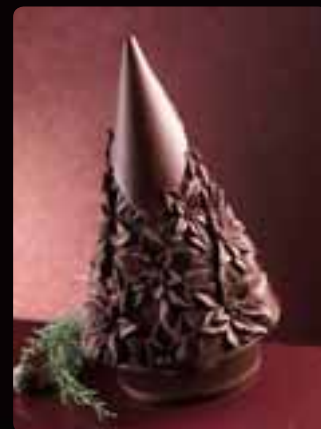
GUSCIO PINO STELLE DI NATALE Cod. Art. 12302

Tutti i soggetti PINO hanno un diametro di base di cm 16 per h cm 23.