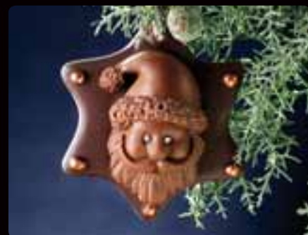
BABBO NATALE Cod. Art. 4046