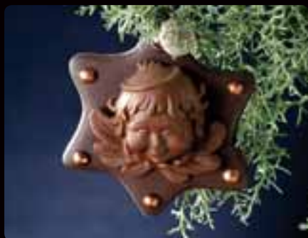
ADDOBBO ANGELO Cod. Art 4049

Tutti i soggetti ADDOBBO hanno un diametro di cm 11 e uno spessore massimo di cm 3