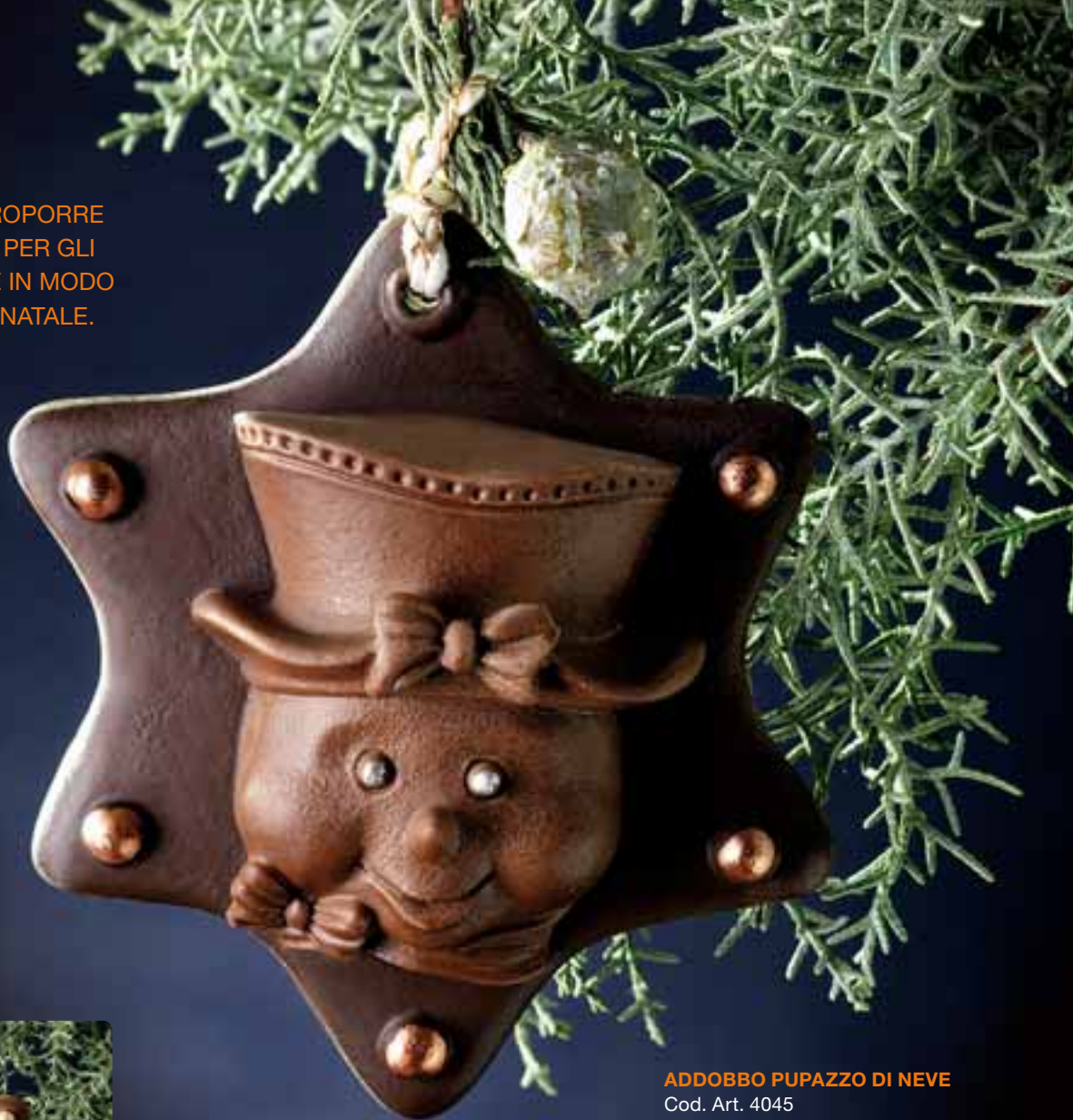
ADDOBBO PUPAZZO DI NEVE Cod. Art. 4045

ELEGANTI STELLE DA PROPORRE COME UN DOLCE DONO PER GLI AMICI O PER DECORARE IN MODO ORIGINALE L'ALBERO DI NATALE.