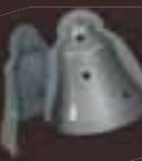
TERMOFORMATO CAMPANA LINEAGUSCIO KIT 2 PZ Cod. Art. 12400