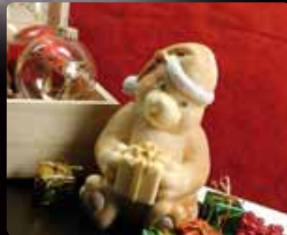
ORSACCHIOTTO Cod. Art. 4040.