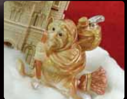
BEFANA Cod. Art. 4038 Dimensioni del soggetto: b cm 14,1 x h cm 13,5 x p cm 7,2