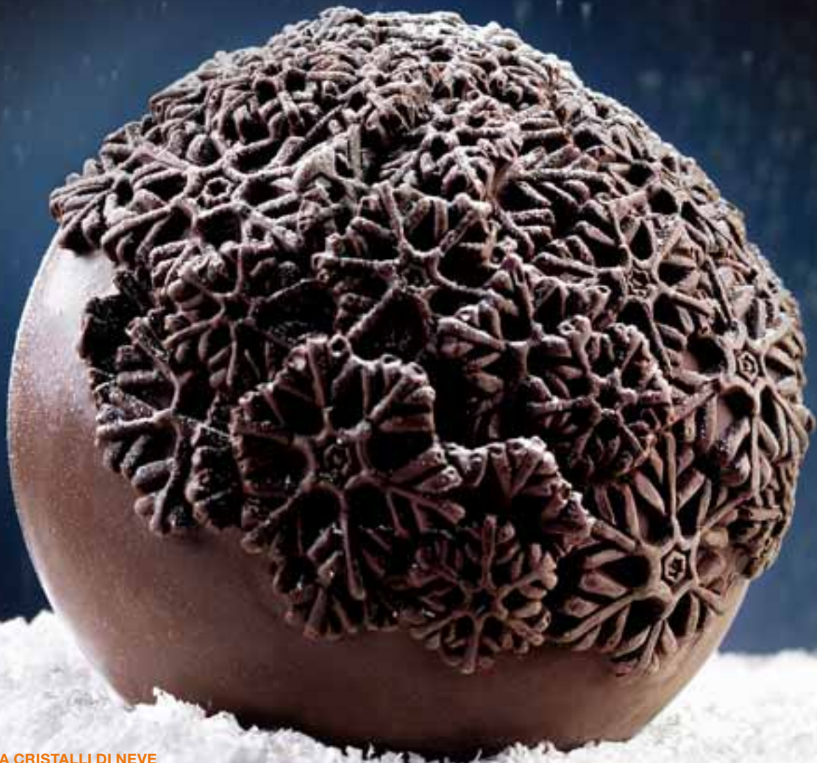
GUSCIO SFERA CRISTALLI DI NEVE Cod. Art. 12605

Tutti i soggetti SFERA hanno un diametro di 13 cm