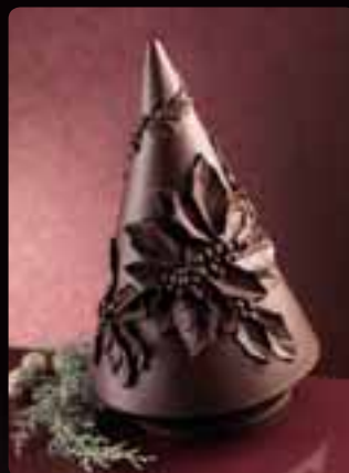
GUSCIO PINO AGRIFOGLIO Cod. Art. 12301