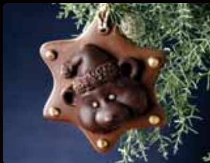
ADDOBBO ORSETTO Cod. Art. 4047