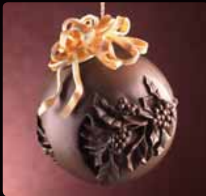
GUSCIO SFERA AGRIFOLIO Cod. Art. 12602