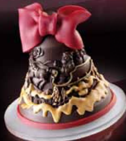
GUSCIO CAMPANA ANGELI MUSICI Cod. Art. 12401