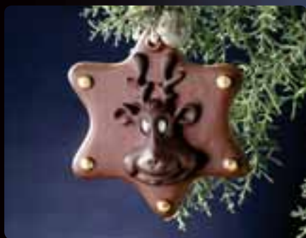
ADDOBBO RENNA Cod. Art. 4048

Tutti i soggetti ADDOBBO hanno un diametro di cm 11 e uno spessore massimo di cm 3