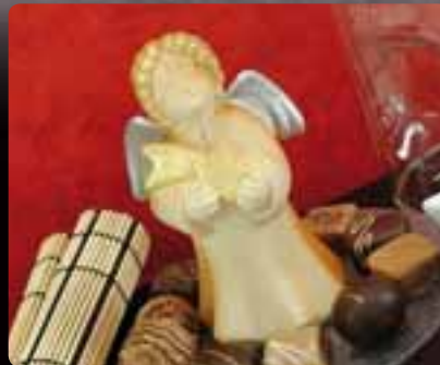
ANGELO Cod. Art. 4023 Dimensioni del soggetto: b cm 6 x h cm 13,5 x p cm 6

RICORDA GLI STAMPI GIÀ PROPOSTI NEL 2009: DAI SPAZIO A TUTTA LA TUA CREATIVITÀ ABBINANDOLI AI NUOVI SOGGETTI.