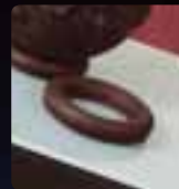
BASE SFERA Cod. Art. 12604

La base è un articolo a sè stante e come tale va acquistato a parte.