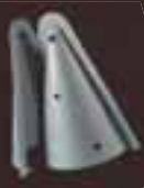
TERMOFORMATO PINO LINEAGUSCIO KIT 2 PZ Cod. Art. 12300

Il Termoformato è un articolo a sè stante e come tale va acquistato a parte.