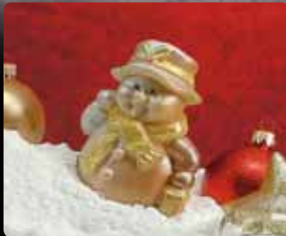
PUPAZZO DI NEVE Cod. Art. 4039.