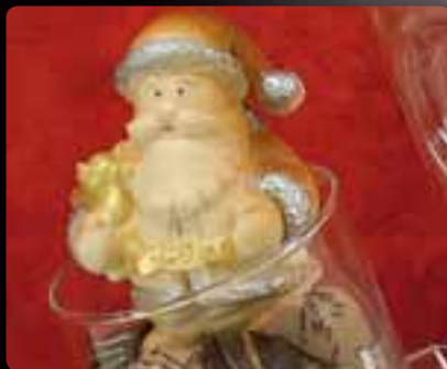
BABBO NATALE Cod. Art. 4019.